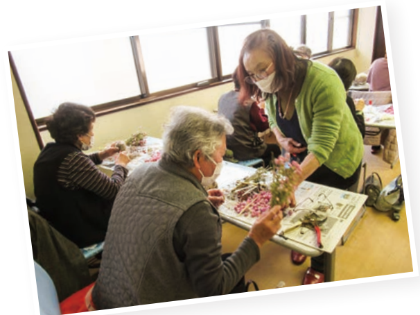
▲ ボランティア養成講座