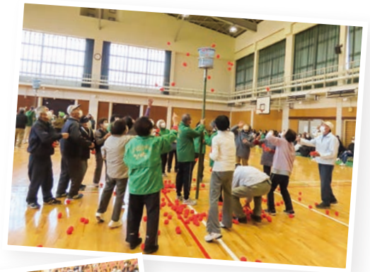
▲ 老人スポーツ大会